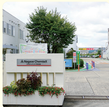
▲たつの市にある播磨事業所

私たちは、スマートフォンなどに使われる「半導体」や、自動車、日用品など、暮らしに欠かせないものに使われる化学製品をつくり、日本だけでなく世界中に届けています。より性能の高い「先端半導体」に使われる材料の開発にも力を入れていて、健康や医療に関わるライフサイエンスや農業など、未来の暮らしを豊かにする研究も進めています。たつの市には、生産拠点のひとつである播磨事業所があり、姫路オフィスは、会社の他拠点の従業員や社外の人が交流できる場所となっています。